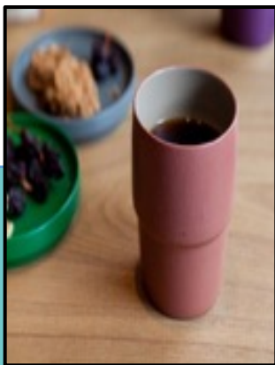
はじめてのうるし